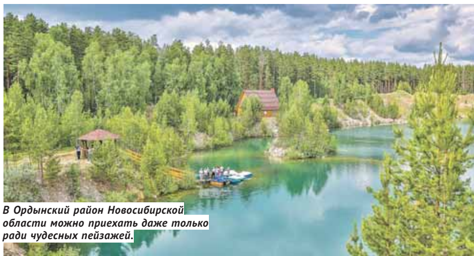
В Ордынский район Новосибирской области можно приехать даже только ради чудесных пейзажей.

За прошлый год доход Новосибирской области в сфере туризма составил 3,3 млрд рублей, из них около 1,4 млрд — услуги санаторно-оздоровительных орга-