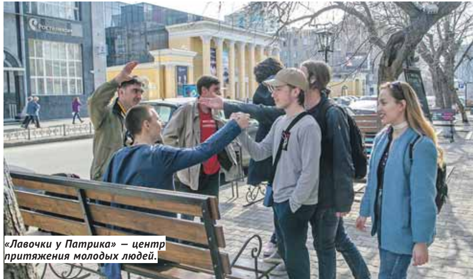
«Лавочки у Патрика» — центр притяжения молодых людей.

В историческом «калейдоскопе» Константина Голодяева меняются картинки. Базарная площадь «окультуривается»: в 1911 году заканчивается строительство Торгового корпуса, в 1914-м — здания Богородско-Глуховской мануфактуры (Главпочтамт),