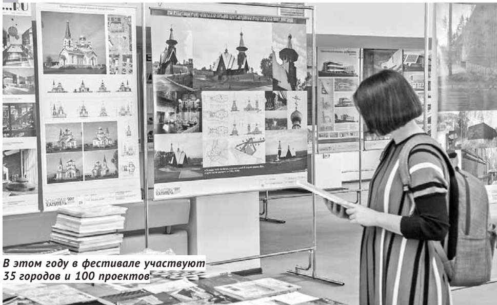
В этом году в фестивале участвуют 35 городов и 100 проектов

ВНИМАНИЕ! Новосибирцев приглашают принять участие в конкурсе социальной рекламы.