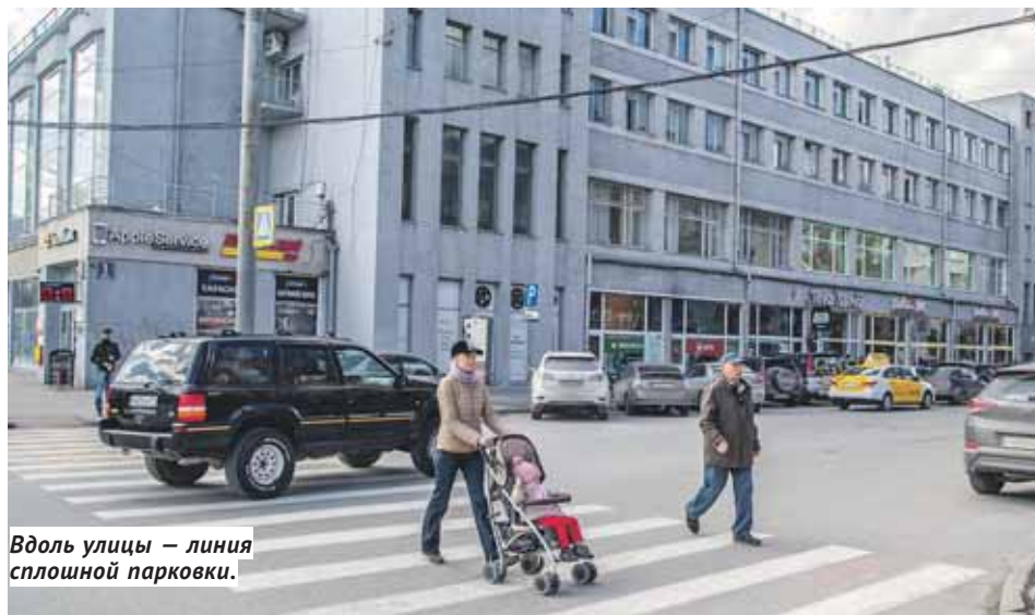
Вдоль улицы — линия сплошной парковки.

революционный ветер даёт площади имя Ленина. Происходит формирование её современного облика, и в 1970 году завершающим аккордом на ней водружается композиция с Лениным. Кстати, интересный факт — на случай форс-мажора Ильичу «вылепили» брата-дублёра. Но форс-мажора не случилось, и близнецов-Ильичей разлучили: один поехал на ПМЖ в закрытый город Снежинск, а другой пропался в Новосибирске.