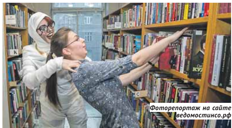
Фоторепортаж на сайте ведомостинсо.рф

В день акции НГОНБ традиционно готовит для своих посетителей немало интересного. Участникам краеведческого теста предлагалось ответить на вопросы — к примеру, есть в Новосибирской области деревня Саратовка и село Антибес? На мастер-классе по рисованию комиксов нужно было дорисовать комикс или досочинять текст к нему. А открытое обсуждение «Недетские книги — почему взрослые читают подростковые романы» проходило с онлайн-участием ведущих детских издательств.