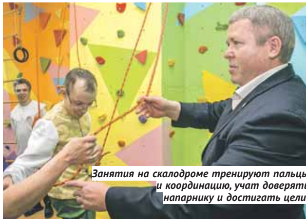
Занятия на скалодроме тренируют пальцы и координацию, учат доверять напарнику и достигать цели.