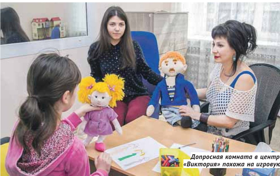
Допросная комната в центре «Виктория» похожа на игровую.